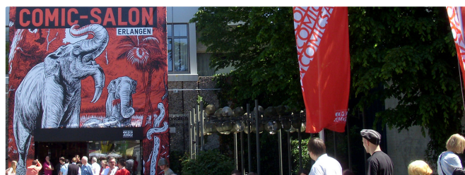
Comic Salon (Viola Raabe © Erlanger Tourismus)

Kultur wird in Erlangen großgeschrieben. Das Stadtmuseum zeigt neben der Geschichte Erlangens interessante Sonderschauen. Im Kunstpalais, das sich im aufwendig sanierten Palais Stutterheim befindet, sind hochkarätige Ausstellungen Programm. Theater gibt es auf den großen und kleinen Bühnen der Stadt. Und dann sind da natürlich noch die Kultur-Festivals, für die Erlangen über die Landes-