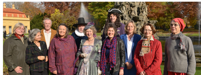
Die Erlanger Stadtführer (Bernd Böhner © Bernd Böhner)

Entdecken Sie die Stadt Erlangen in all ihren Facetten Auf unseren geführten Stadtsparziergängen lassen wir vergangene Zeiten wieder lebendig werden und decken die zahlreichen Facetten der Stadt auf: die berühmten, die bekannten und die verborgenen Seiten.